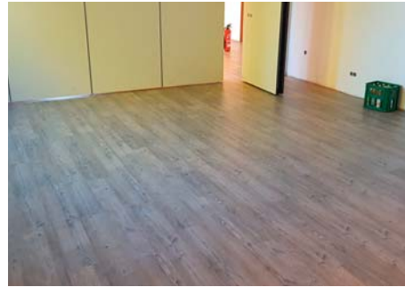
Der Fußboden liegt schon!